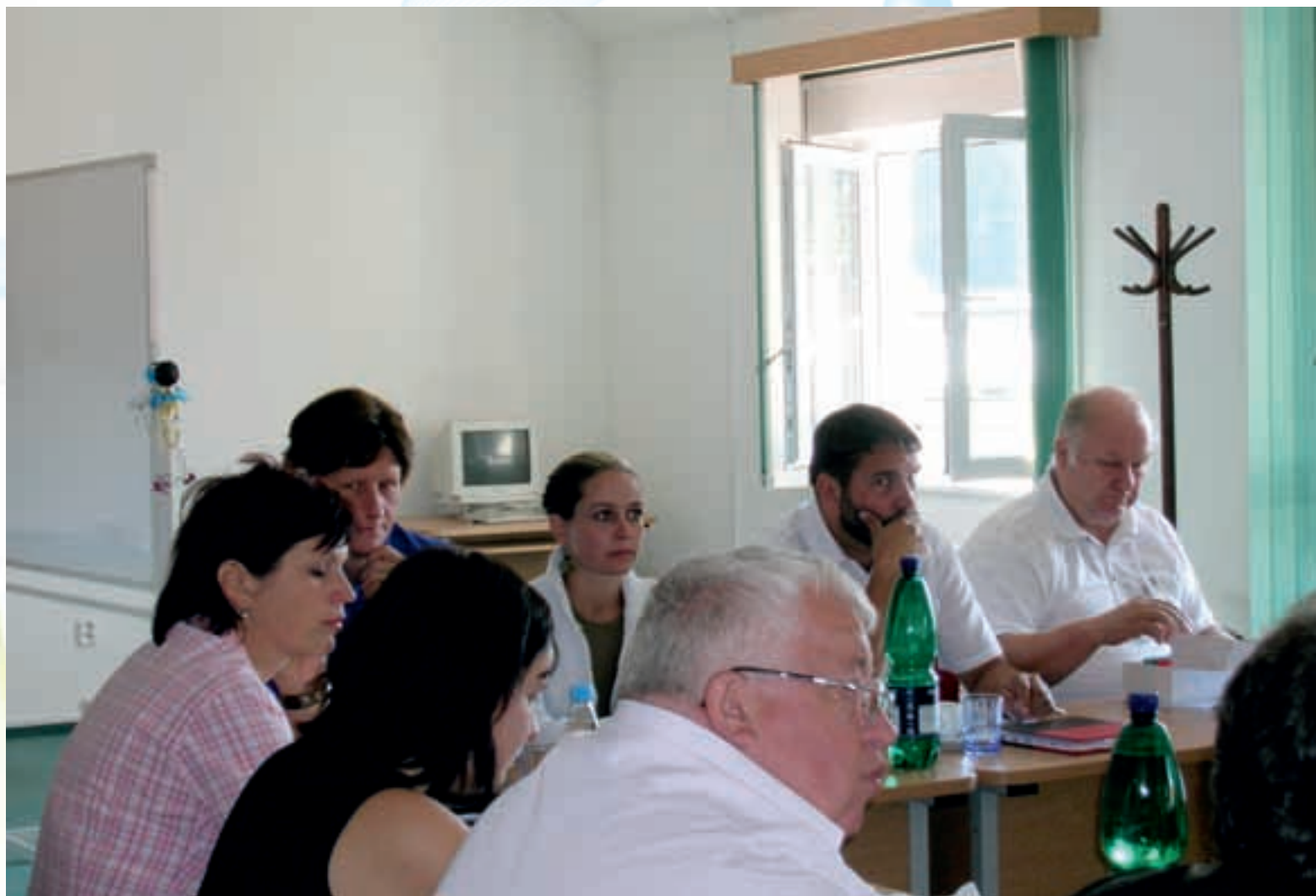
Školení profesionálů moravskoslez- ského venkova

Partnerství v projektu Národní observatoře venkova, o.p.s. „Profesionálové moravskoslezského venkova“. Realizace projektu byla zahájena na podzim roku 2006 a její ukončení je plánováno v červnu 2008.