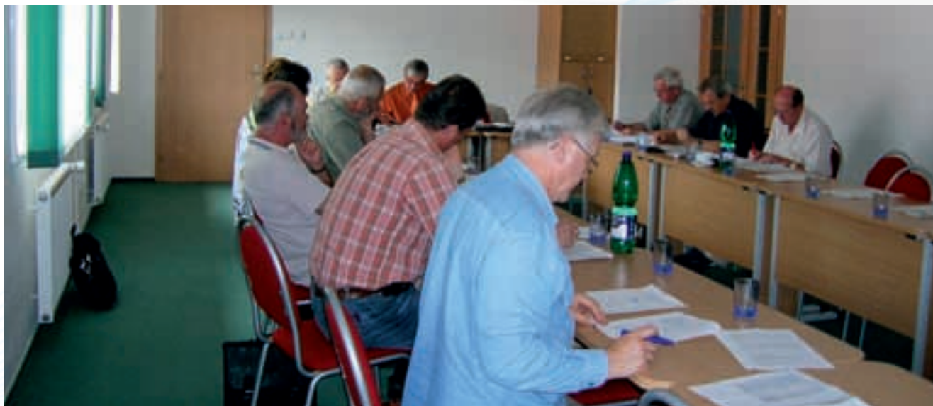
Jednání Valné hromady MAS