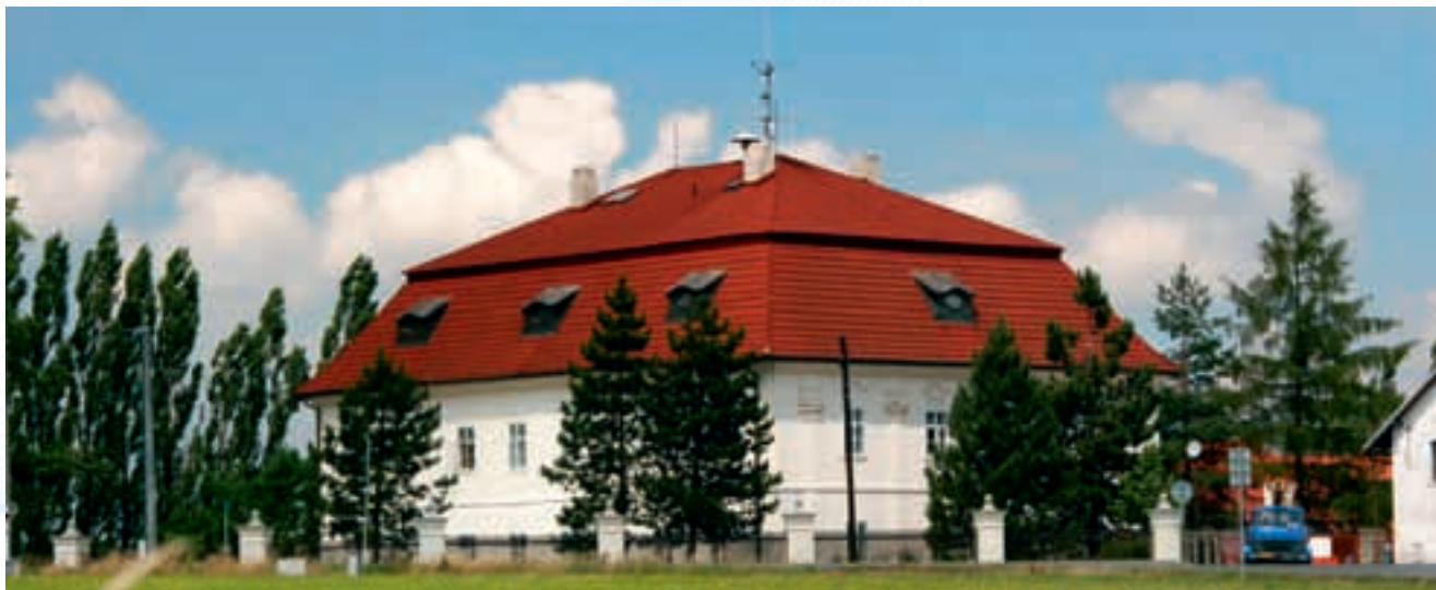
Sídlo člena MAS - TOZOS s.r.o.