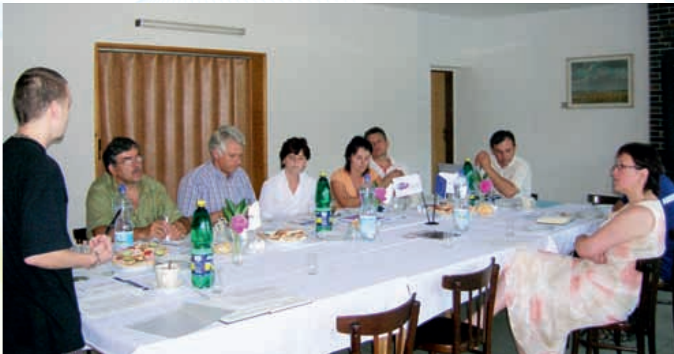
Tvorba Strategického plánu Leader

Veškeré informace související s realizací Strategického plánu LEADER MAS Pobeskydí jsou průběžně zveřejňovány na internetových stránkách www.pobeskydi.cz .